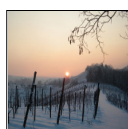
Tramonto di neve

→→→ Piatti Doc tra testimonianze del Pliocene [.pdf : 28,5 Kb]