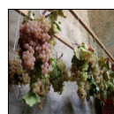
Uva da tavola